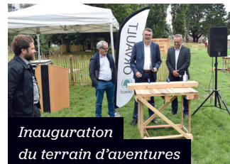
Inauguration du terrain d'aventures