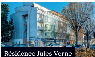
Résidence Jules Verne