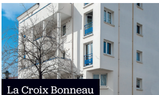
La Croix Bonneau