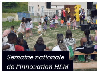
Semaine nationale de l'innovation HLM