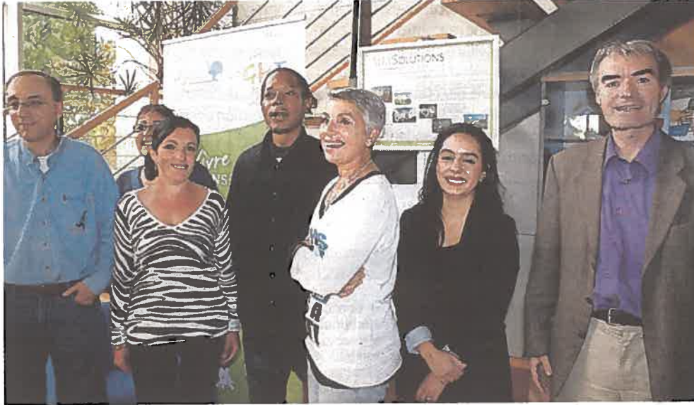
Une partie des membres de la première Académie Solidaire lors du lancement de ce dispositif innovant.

A tlantique Habitations a accueilli la première promotion de son Académie solidaire. Cette dernière est formée de 8 locataires sélectionnés de Saint-Herblain, Rezé, Orvault, âgés de 27 à 58 ans.